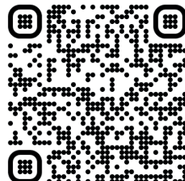
Instagram Estudiantiles FAU

Escaneá los QRs y accedé a las páginas de la FAU